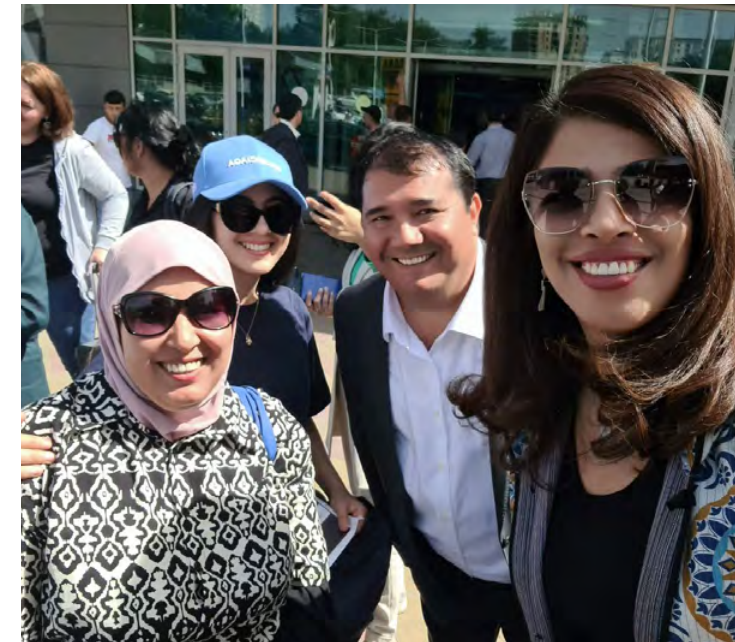
All of the pictures in this section ©Lyorjon Ehsonov

“ Fear does not extend life, while courage does not shorten it. ”